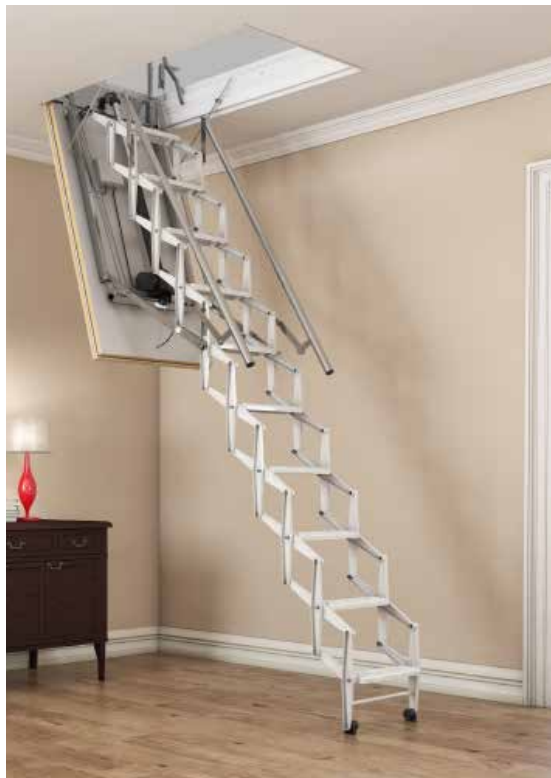
Elektrische Scherentreppe mit Komfort auf Knopfdruck